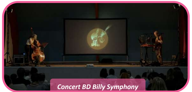
Concert BD Billy Symphony