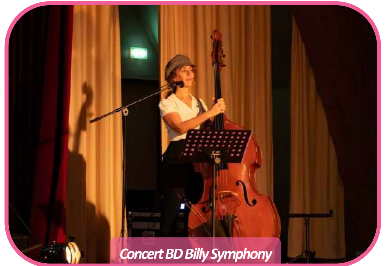
Concert BD Billy Symphony