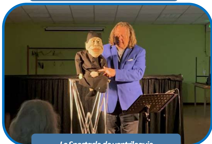
Le Spectacle de ventriloquie