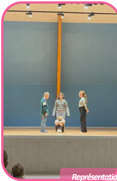
Représentation actions harcèlement