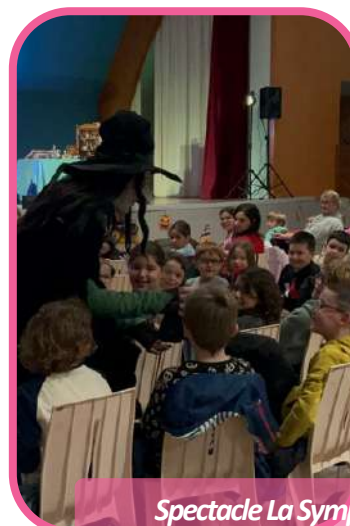
Spectacle La Symphonie des Sorcières