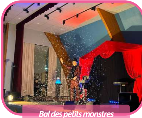
Bal des petits monstres