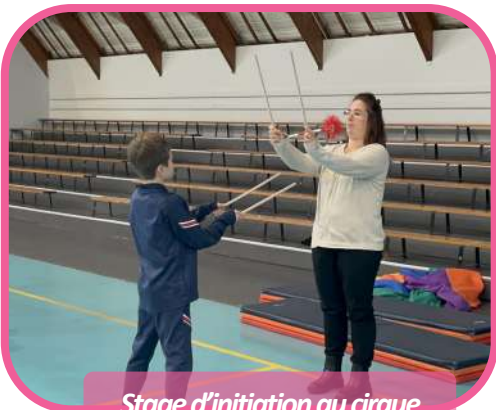
Stage d'initiation au cirque