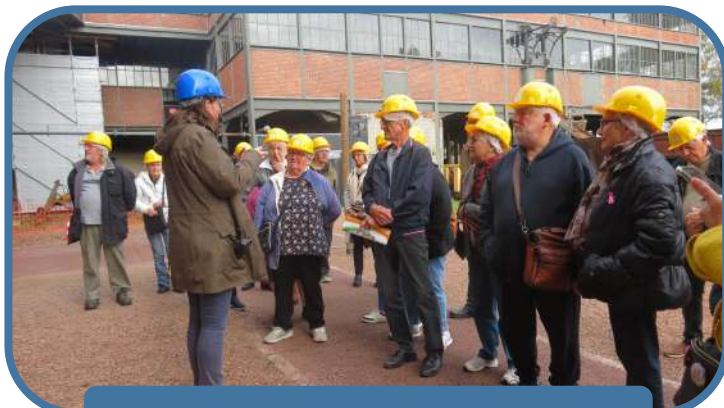
La visite au musée de la Mine de Lewarde