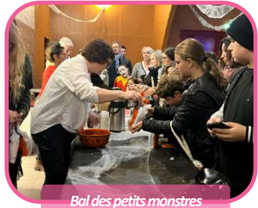
Bal des petits monstres