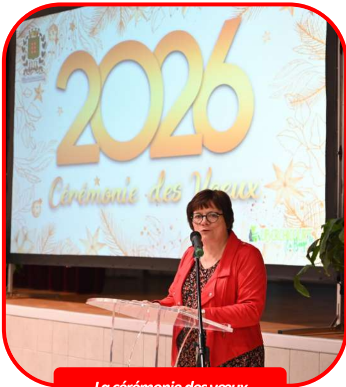
La cérémonie des vœux