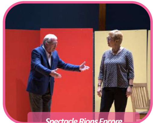
Spectacle Rions Encore