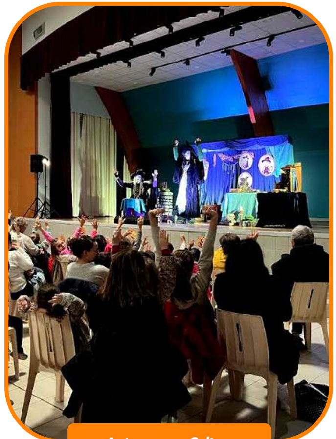
Automne en Culture