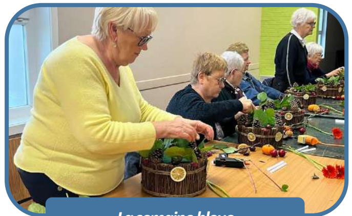
La semaine bleue