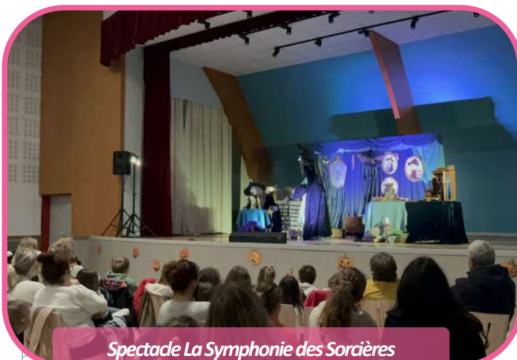
Spectacle La Symphonie des Sorcières