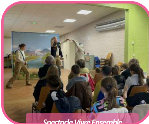
Spectacle Vivre Ensemble