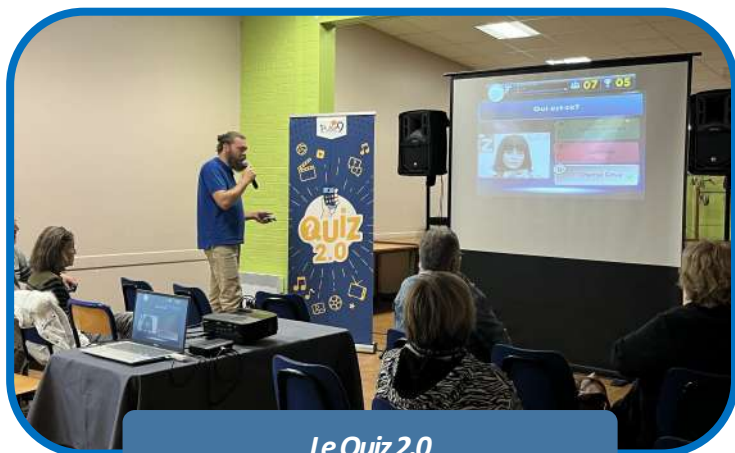
Le Quiz 2.0