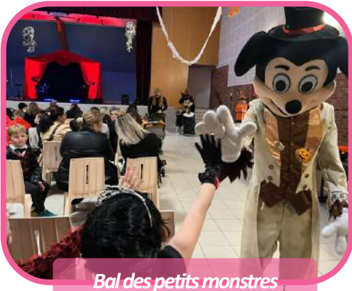
Bal des petits monstres