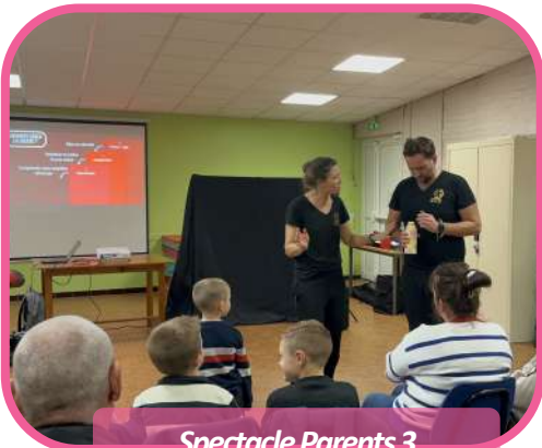
Spectacle Parents 3