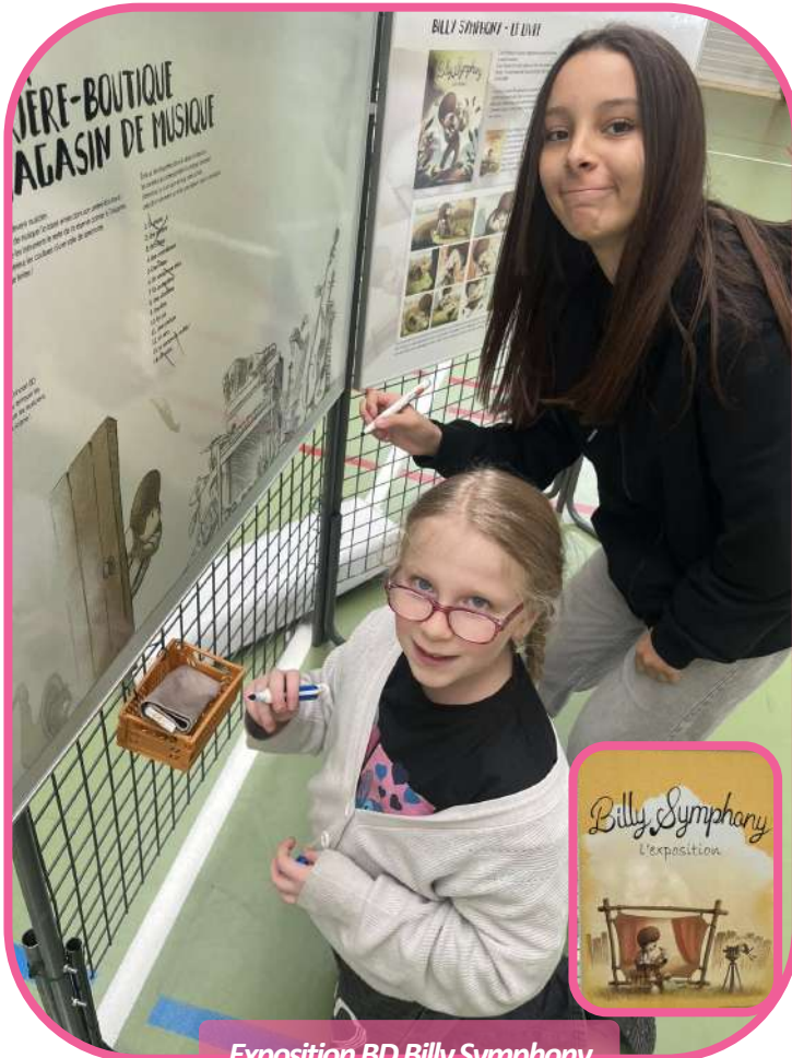
Exposition BD Billy Symphony