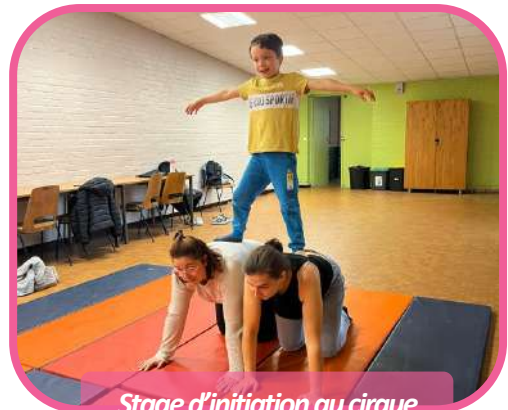
Stage d'initiation au cirque