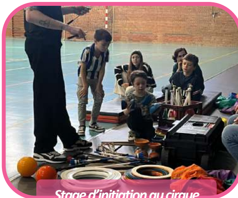
Stage d'initiation au cirque