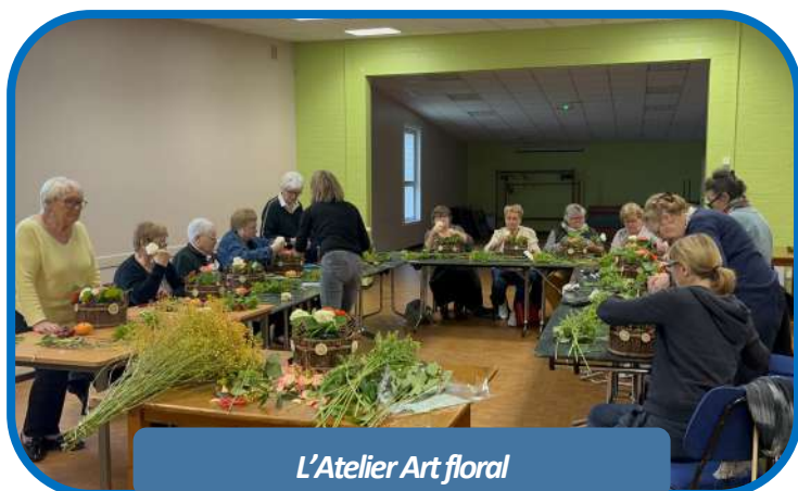
L'Atelier Art floral